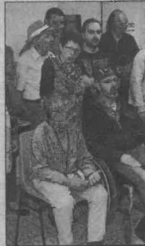
COMÉDIE MUSICALE. Scène ouverte à chanté.

Pour clore cette journée festive, une quinzaine d'acteurs de la troupe Scè-