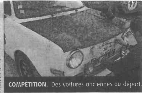
COMPÉTITION. Des voitures anciennes au départ.

ne ouverte (une association qui accueille des personnes en souffrance psychique) ont présenté des extraits de la comédie musicale Félures . L'histoire d'un cataclysme qui s'abat sur un hôpital psychiatrique : les survivants vont devoir s'entendre pour reconstruire une société... L'œuvre sera bientôt jouée au théâtre d'Orléans, puis au théâtre Gérard-Philipe, à Orléans La Source, et à l'espace George-Sand à Chécy. ■